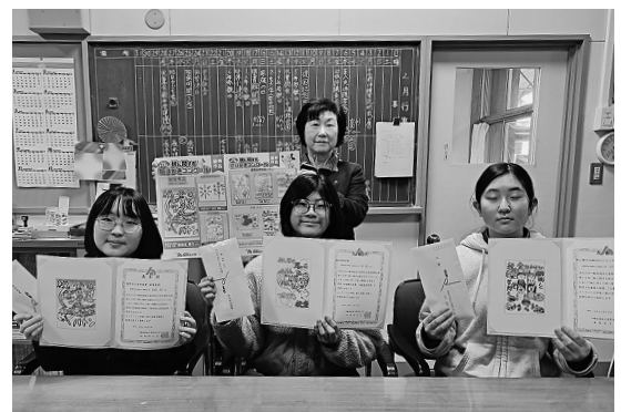
表彰状を手にする受賞者(後列は古旗女性部長)