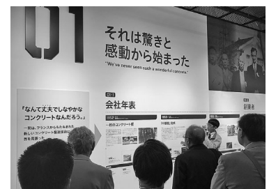
PC技術の説明を受ける参加者

福井県を代表する企業を視察したことで、新たな発見やインスピレーションが生まれるきっかけとなる良い視察研修となった。