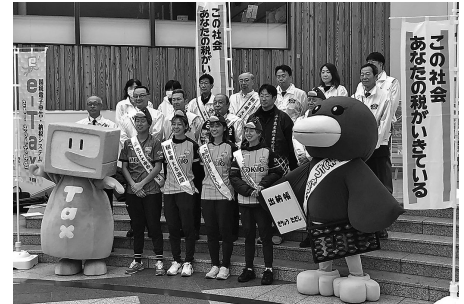
長野駅で行った街頭広報活動

11月11日(月)にJR長野駅で長野税務署および協力関係団体、AC長野パルセイロレディースの3選手と一緒に通勤通学の市民へ呼びかけを行った。