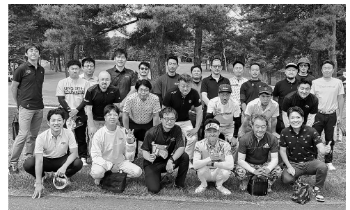
ゴルフプレー前に一枚

次回、青年部例会は7月9日(火)～10日(水)に経営研修委員会による視察旅行を開催する。