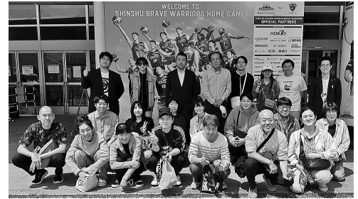
ホワイトリング入場口にて

その後、試合を観戦し、選手たちの迫力あるプレーを間近で楽しんだ。参加者からは「試合は負けてしまったがとても白熱した良い試合だった。また観戦に来たい」と好評だった。